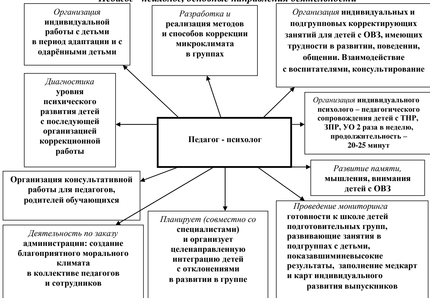
Рис. 2 «Педагог - психолог, основные направления деятельности»